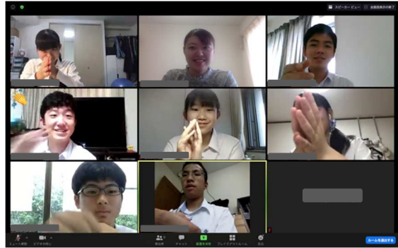
2 ラウンド目 ラウンド後に握手をします

2 ラウンド目終了後は昼食時間です。オンラインという形ではありましたが、方言や分散登校の状況についてなど情報共有や意見交換を行いました。