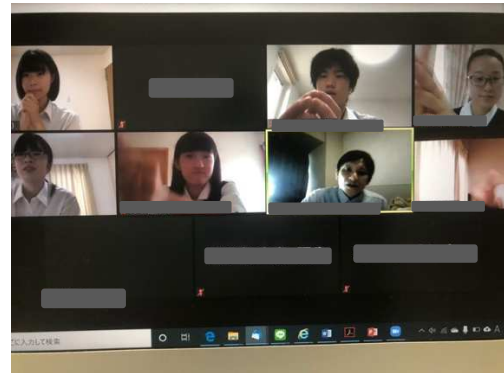
2 ラウンド目 お互いに健闘をたたえ合います