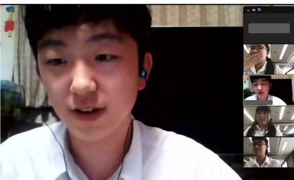
1ラウンド目 岐阜 vs 静岡