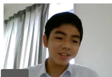
5位 岐阜 B