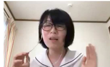
エキシビジョンの様子