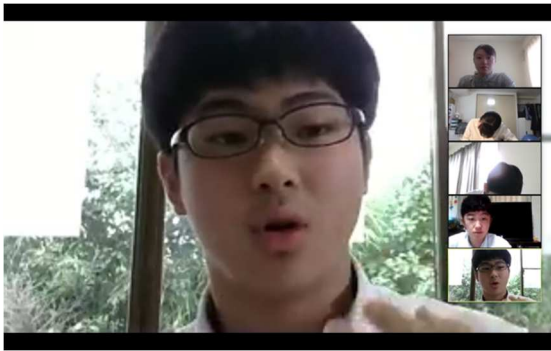
2 ラウンド目 四日市 vs 岐阜