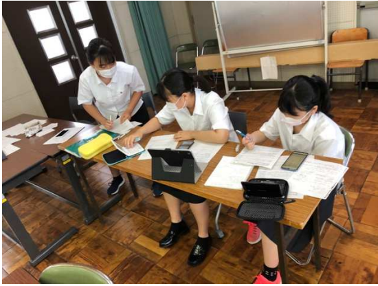
準備時間（静岡高校）