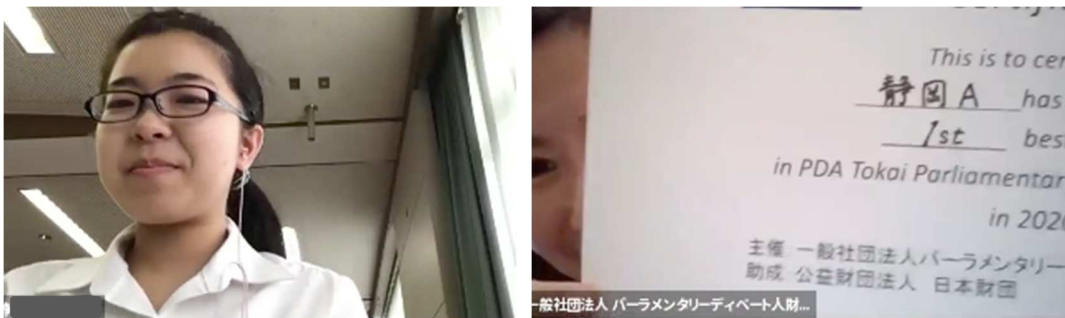
1位 静岡 A へ賞状が授与されています