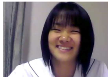
6位 四日市 A