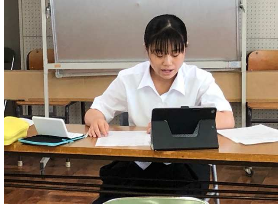
画面の向こうにいる聴衆へスピーチをします