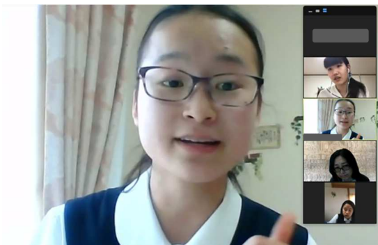
1ラウンド目 岡崎 vs 四日市