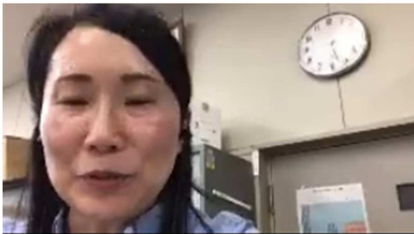
静岡高校 熊ヶ谷教頭先生

最後に、ベストディベーターに選ばれた生徒が「他の参加した生徒から学ぶものがとても多く、勉強になった1日だった。」と感想を述べ、3回目となるPDA 東海公立高校即興型英語ディベート交流大会が終了しました。