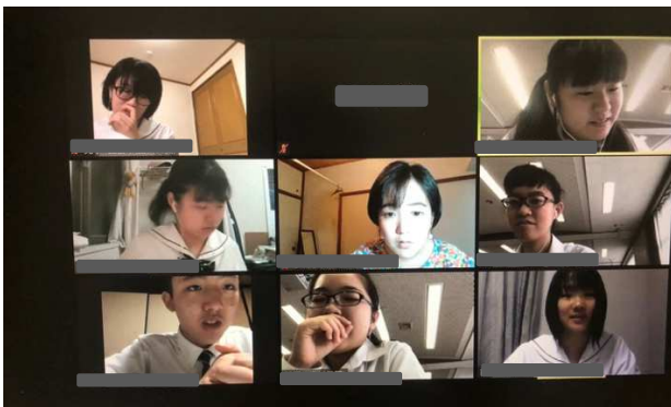
2 ラウンド目 静岡 vs 四日市

1 ラウンド目が終わると、すぐさま2 ラウンド目が始まりました。2 ラウンド目の論題は「School summer holidays should be shortened. (学校の夏休みは短縮されるべきである。)」でした。夏休みがあると塾に行くことができない生徒や家で集中することが難しい生徒の観点や勉強の苦手なところや運動などを自分のペースでやりたい生徒の観点などから夏休みは長いほうがいいのか短いほうがいいのかについて議論しました。ディベートが終わると、お互いに意見交換をしたり、交流したりする様子がみられました。