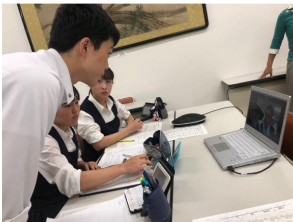
接続確認をします

お昼休憩を挟み、続く第2ラウンドのお題は、「 We should prohibit the elderly from driving cars. （高齢者の自動運転を禁止するべきである。）」でした。日本では日々議論されているテーマであり、そのため多くの生徒が一度は考えたことのあるテーマでした。論題を見た生徒は、今まで考えてきたことをジャッジにわかりやすく伝えるためにはどうしたらよいか、相手の反論に備えるにはどのように立論をすればよいかなどについて準備時間にチームメイトと相談し、肯定する理由/否定する理由を説得的に述べるだけでなく、相手のチームのメリットがいかに小さいかなどという視点から立論を行っていた生徒も見受けられました。