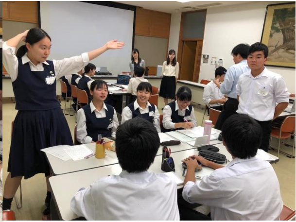
相手の目をしっかり見てPOI

お昼休憩を挟み、続く第2ラウンドのお題は、「 We should prohibit the elderly from driving cars. （高齢者の自動運転を禁止するべきである。）」でした。日本では日々議論されているテーマであり、そのため多くの生徒が一度は考えたことのあるテーマでした。論題を見た生徒は、今まで考えてきたことをジャッジにわかりやすく伝えるためにはどうしたらよいか、相手の反論に備えるにはどのように立論をすればよいかなどについて準備時間にチームメイトと相談し、肯定する理由/否定する理由を説得的に述べるだけでなく、相手のチームのメリットがいかに小さいかなどという視点から立論を行っていた生徒も見受けられました。