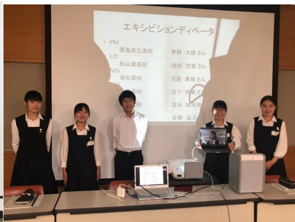
エキシビジョンでは遠隔で選ばれた生徒も一緒に

エキシビジョンディベートが終わると、チェアを務めた先生より勝敗の発表があり、会場から健闘をたたえ、両チームへ大きな拍手が送られました。聴衆の多数決では賛成側が勝ったということになりましたが、チェアジャッジの先生は否定側を勝ちにしており、大変接戦ないい試合であったことが伺えます。