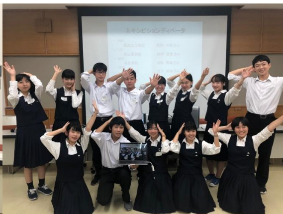
生徒さんの集合写真