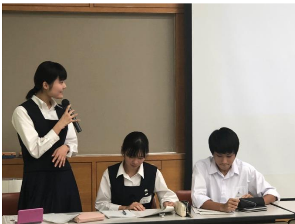
スピーチ頑張ります