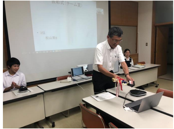
第三位：松山東 B(PC 越しに表彰)