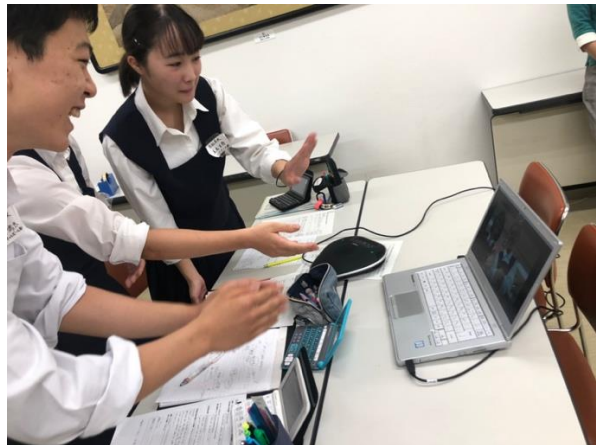
遠隔のディベート相手に手を振って挨拶

次に、ジャッジから「もう一度ディベートを見たい！」と推薦された生徒によるエキシビジョンディベートです。お題は「 Term-exam should be abolished. （期末テストを廃止するべきである。）」でした。今大会で初めて会う他校の生徒と一緒にチームを組むということもあって、ラウンド前にはにこやかな挨拶が両チーム内で交わされました。期末テストが当たり前にある生徒にとって、それを廃止する理由を考える賛成側は苦戦していた模様ですが、チームで協力して両チームとも活発にスピーチの準備を行っていました。POIも飛び交う大変活発なラウンドとなりました。