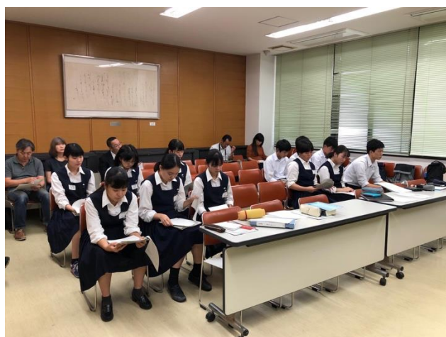
モデルスピーチのフロー取り