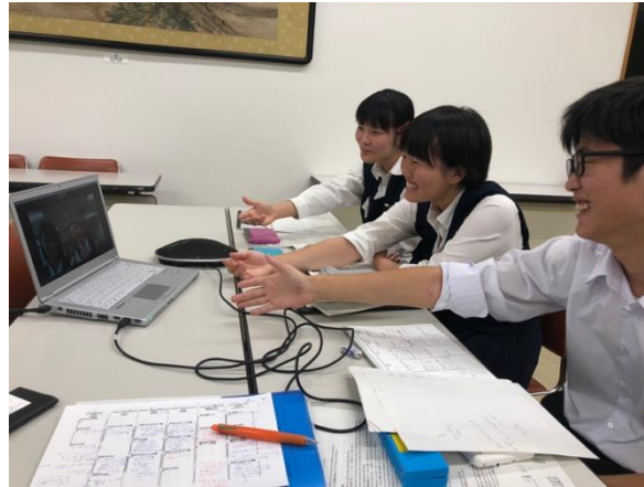
PC越しでも握手は欠かさない

次はいよいよ表彰の対象となるラウンドの始まりです。第1ラウンドのお題は「 Fast food should be banned. (ファストフードを禁止するべきである。) 」でした。普段ファストフードを食べることも多い生徒たちにとって身近な論題だったため、例をたくさん用いられた説得力の高いスピーチが多く見受けられました。試合前にテーブルジャッジよりPOIを遠慮なくするように促したところ、1つのスピーチに1つ以上のPOIを打つチームも見受けられ、非常に活発で白熱したディベートとなりました。