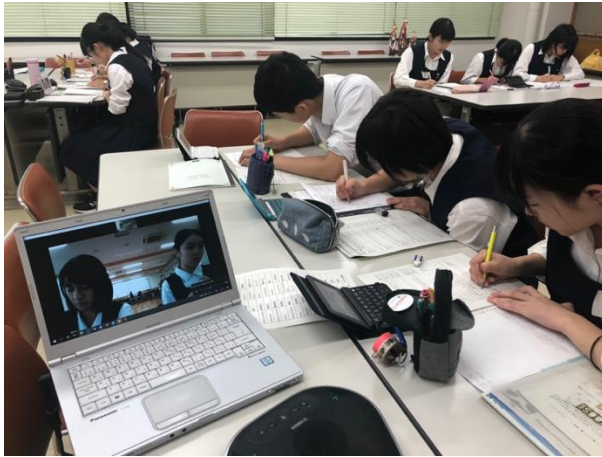
各チームの準備時間