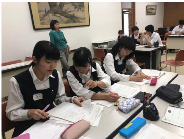
チームメイトとの準備時間

ミックスディベートのお題は「 Single-sex schools are better than co-educational schools. (共学より男子校または女子校のほうがよい。) 」でした。初めて一緒にチームを組むメンバーでのディベートにはじめは緊張した雰囲気もありましたが、共学と男子校・女子校それぞれのメリットやデメリットをアイデア交換する中で少しずつ緊張も解れていきました。ディベートでは、自分たちの学校の様子を例に出すなど活発な議論が行われました。