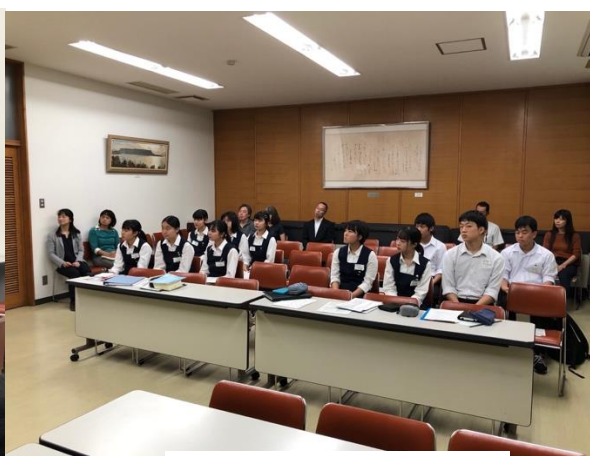
ルール説明を聞く生徒