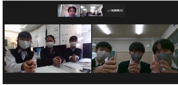
浦和第一女子高校 VS 三田高校