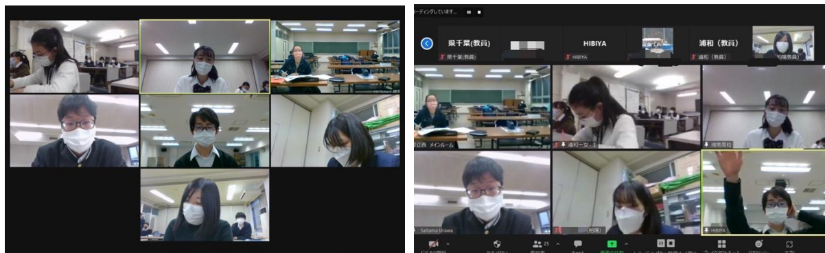
エキシビジョンディベート

そしてジャッジが高く評価した生徒6名によるエキシビジョンディベートが始まりました。論題は「 It is better to study in the U.S. during high school days than after entering university in Japan. (アメリカに留学するなら、大学入学後よりも、高校在学中にしたほうがよい。)」でした。肯定側は、多様性を学ぶことの重要性についてアメリカの特徴を分析しながら説明し、否定側は大学入学後の方がやりたいことや学びたいことが明確なため、得るものがより大きいのではないかと説明しました。POIが飛び交い、白熱した議論となりました。