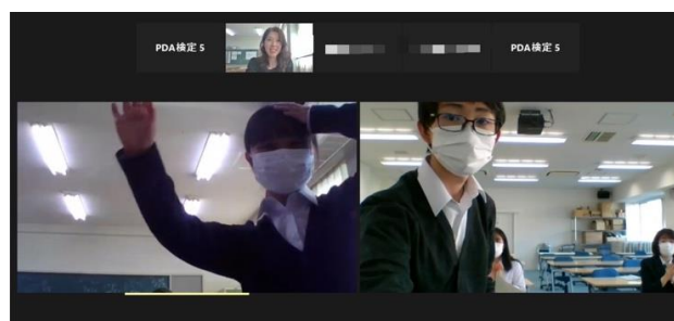
県立船橋高校 VS 日比谷高校