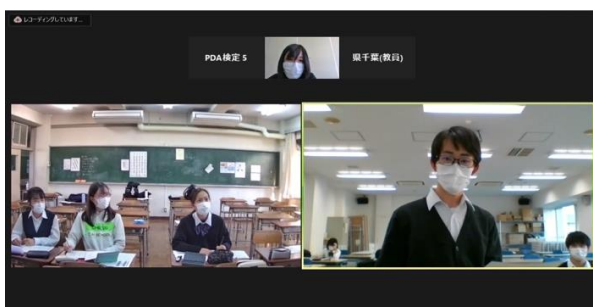
県立千葉高校 VS 日比谷高校