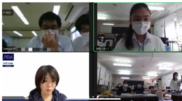
柏陽高校 VS 浦和第一女子高校