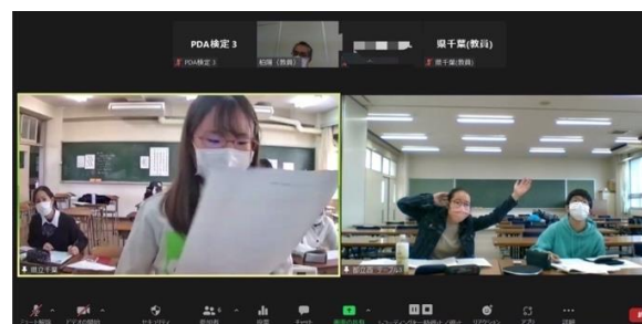
県立千葉高校 VS 都立西高校