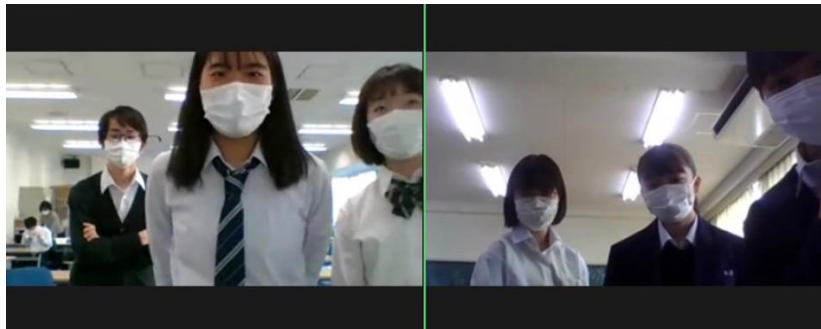
ディベート後の交流

休憩をはさみ、第3ラウンドです。お題は、「 In every public place, vaccine passport should be required to show. (あらゆる公共の場所で、ワクチンパスポートの提示を求めるべきだ。)」でした。クラスターを防げる、公共の場所は特に感染リスクを下げなければならないという肯定側の主張に対し、否定側は、ワクチンを打ちたくても打てない人や、ワクチンを打ちたくない人への差別が生まれるのではないかと懸念や、むしろワクチンを打ったから大丈夫という油断につながるのではないかとといった問題を説明しました。