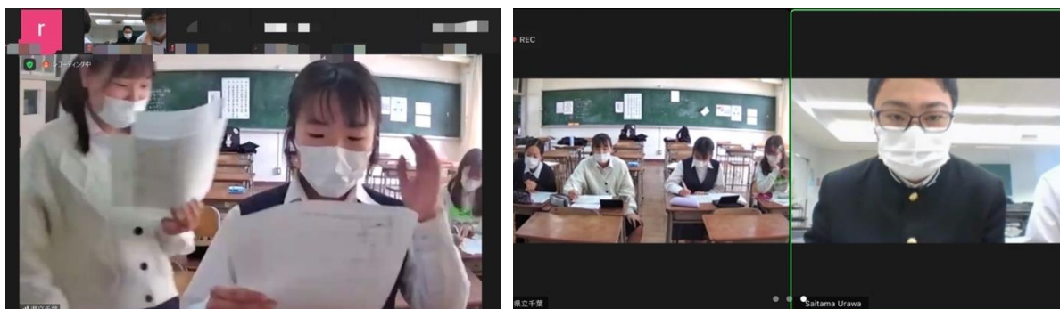
県立千葉高校 VS 浦和高校