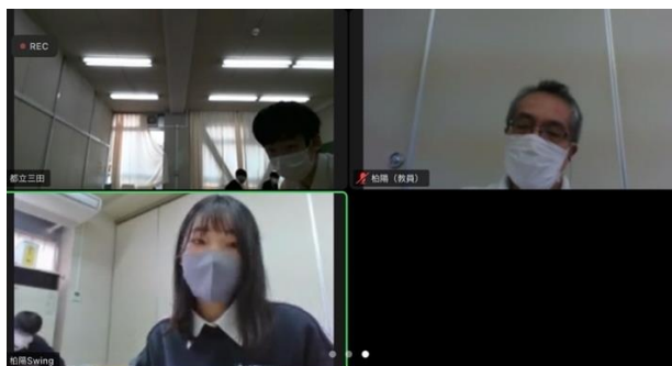
三田高校 VS 柏陽高校 (Swing)