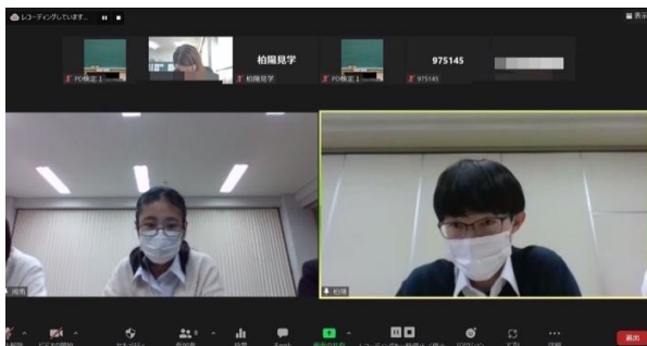
湘南高校 VS 柏陽高校

休憩をはさみ、第3ラウンドです。お題は、「 In every public place, vaccine passport should be required to show. (あらゆる公共の場所で、ワクチンパスポートの提示を求めるべきだ。)」でした。クラスターを防げる、公共の場所は特に感染リスクを下げなければならないという肯定側の主張に対し、否定側は、ワクチンを打ちたくても打てない人や、ワクチンを打ちたくない人への差別が生まれるのではないかと懸念や、むしろワクチンを打ったから大丈夫という油断につながるのではないかとといった問題を説明しました。