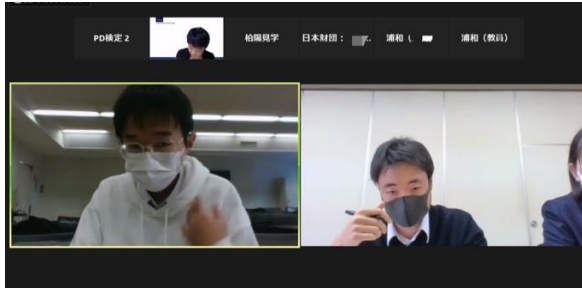
浦和高校 VS 柏陽高校