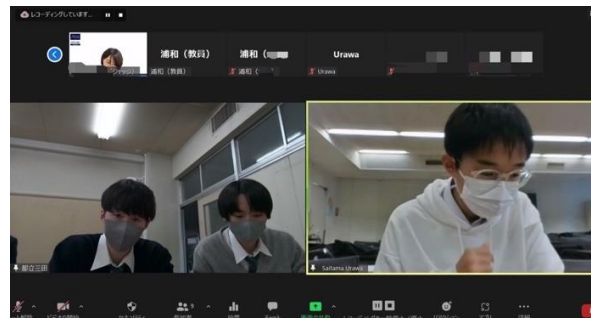
三田高校 VS 浦和高校