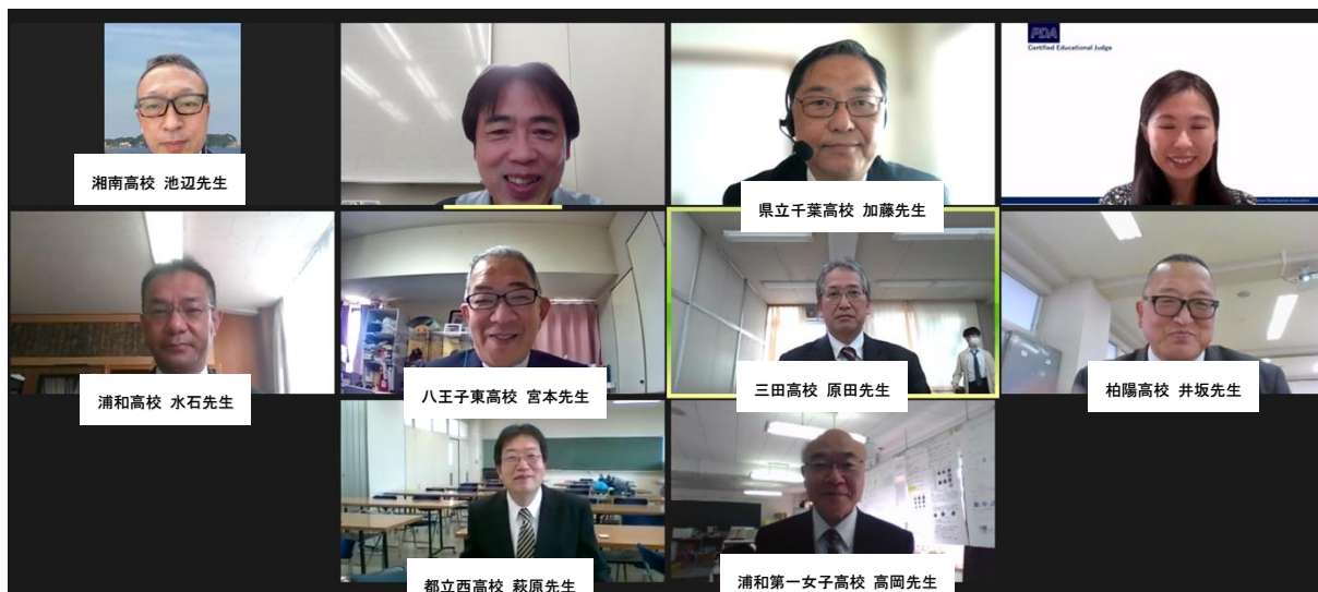
校長先生 集合写真

開会式後、校長集合写真の撮影を行いました。ご多忙な中、撮影にご協力いただきありがとうございました。