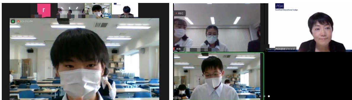
日比谷高校 VS 湘南高校

第1ラウンドのお題は「 Japanese government should introduce compulsory voting. (日本政府は、強制投票を導入すべきである。)」でした。肯定側は日本の投票率の低さに着目し、特に若者のための政策が軽視されていることを問題として挙げ、否定側は何も考えずに投票する人が増えてしまうのではないかという問題やどこにも投票したくない場合の問題を挙げました。中には、「例えば～といった政党が三つあったとします。もし自分の信念と政策が異なった場合どうでしょう？」と具体的に状況を説明する様子も見られました。