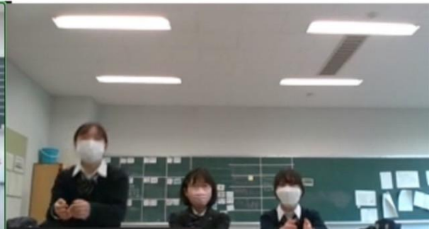
ディベート後のエアークラッシュ（武蔵 VS 両国）