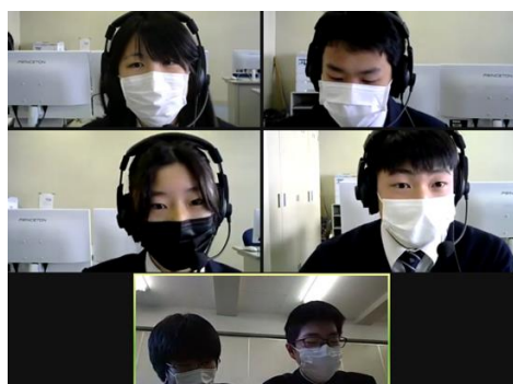
交流の様子（小石川 VS 富士）