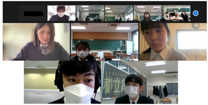
エキシビジョンディベート中の様子