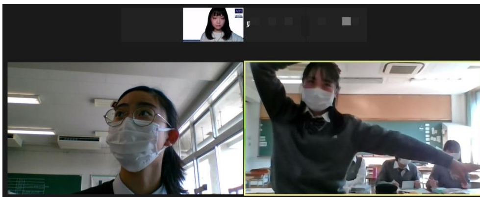
POI ! (桜修館 VS 三鷹)

第1ラウンドのお題は「 In Japan, junior high school students should have part-time jobs. (日本において、中学生はアルバイトをすべきである。)」でした。中学生のうちから金の重要性を学ぶべきだという意見や勉強に集中すべきという意見など、様々な観点から議論しました。POI (ディベート中の質疑応答) も活発に行われ、お互いの意見をより深めようとする姿勢が見られました。