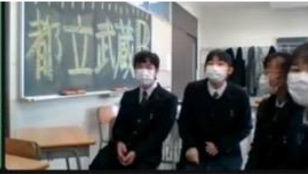
ディベート後の交流（両国 VS 武蔵）