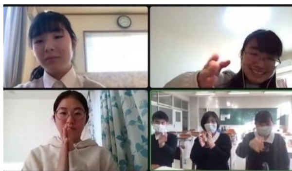
エアー握手（南多摩 VS 白鷗）

そしてジャッジが高く評価した生徒6名によるエキシビションディベートが始まりました。論題は「 Junior high school should divide classes based on grades. (中学校は成績順でクラス分けをすべきだ。)」でした。多くの見学者が画面越しにスピーチに耳を傾ける中、エキシビションディベーターに選ばれた生徒は堂々とスピーチし、時には POI で質疑応答をしながら議論しました。甲乙つけ難いラウンドでしたが、見学していた生徒らの投票により、僅かの差で Government (肯定側) の勝ちとなりました。