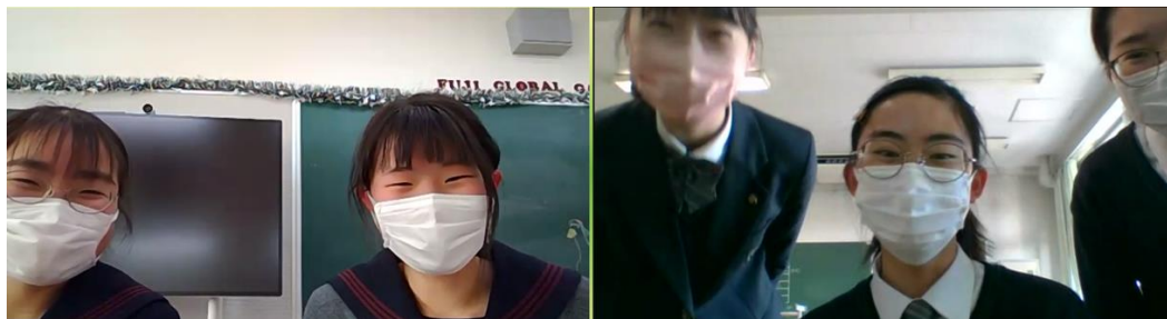
交流の様子（富士 VS 桜修館）

ディベートが終わると、お互いの健闘をたたえて画面越しにエアー握手を行います。ジャッジによるコメントが行われるまでの間、お互いの学校の様子や英語の勉強方法などについて情報交換を行い、楽しく交流しました。