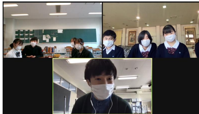
教員ジャッジによるフィードバック