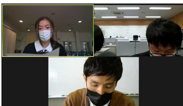
白鷗 VS 大泉