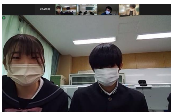
大泉 VS 武蔵