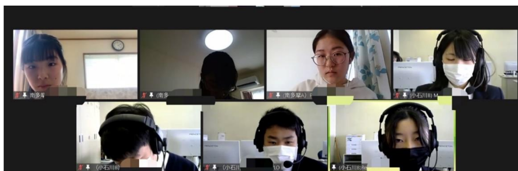
小石川 VS 南多摩