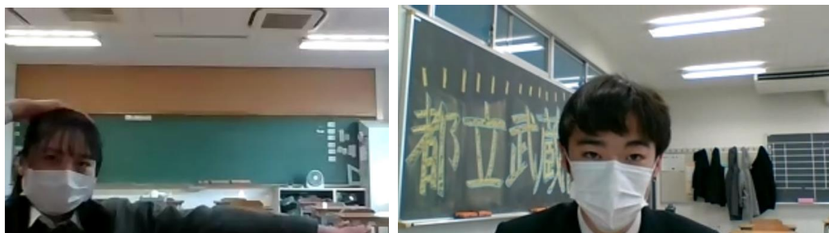
エキシビションディベート

そしてジャッジが高く評価した生徒6名によるエキシビションディベートが始まりました。論題は「 Junior high school should divide classes based on grades. (中学校は成績順でクラス分けをすべきだ。)」でした。多くの見学者が画面越しにスピーチに耳を傾ける中、エキシビションディベーターに選ばれた生徒は堂々とスピーチし、時には POI で質疑応答をしながら議論しました。甲乙つけ難いラウンドでしたが、見学していた生徒らの投票により、僅かの差で Government (肯定側) の勝ちとなりました。