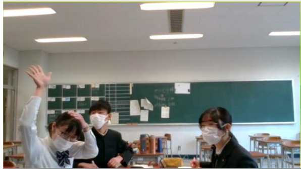
POI！（白鷗 VS 両国）