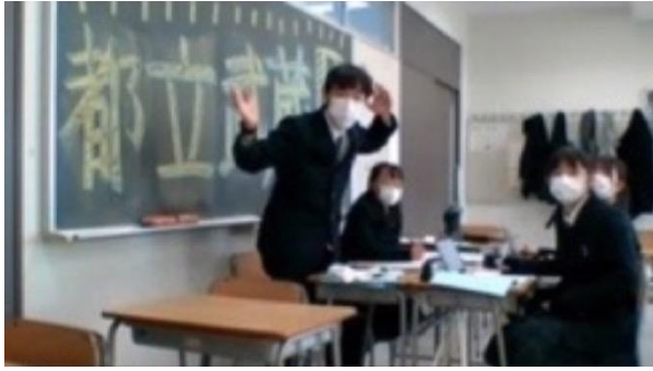
POI！（武蔵 VS 両国）