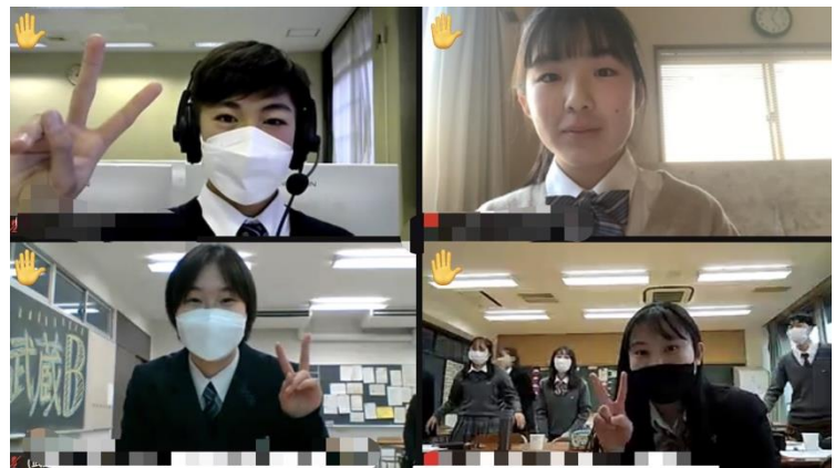
ベストディベータに2回選ばれた生徒