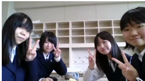
3位 釧路湖陵 B