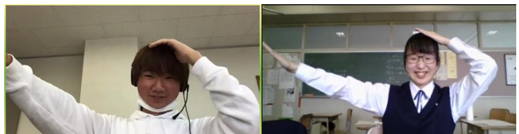
ベスト POI 賞