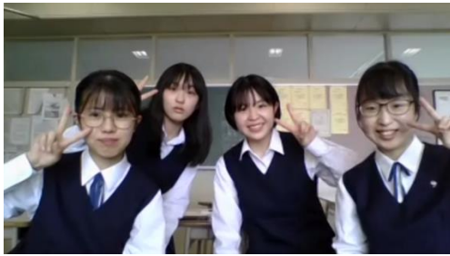
1位 釧路湖陵 A