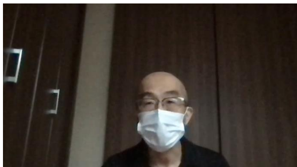
手塚先生によるご挨拶

そして、PDAスタッフより、参加校の紹介やジャッジの紹介、ルールの確認、POI(Point of Information)の練習などが行われました。