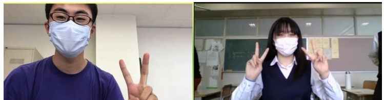
ベストディベータ賞