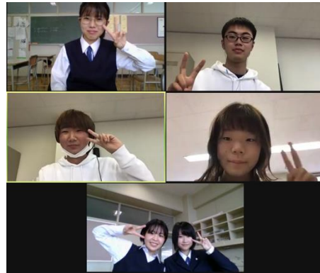
エキシビションディベータ賞