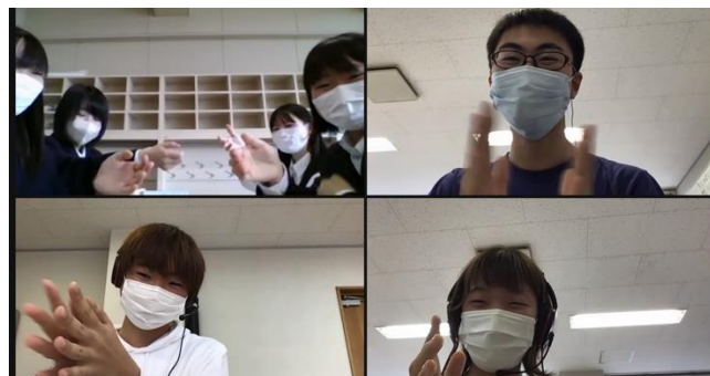
ディベート後のエアークラップ