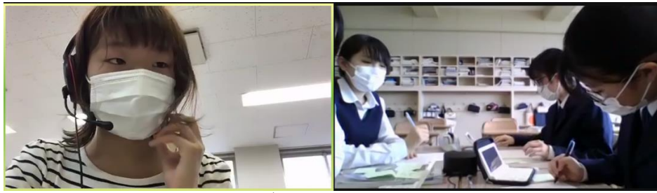
ディベートの様子