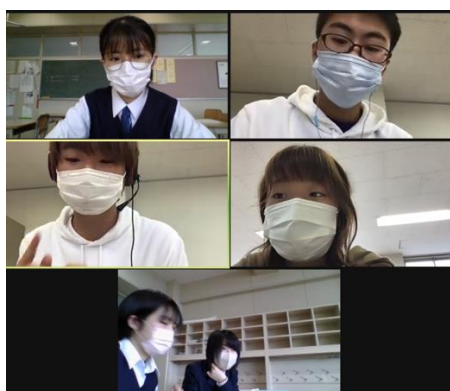
エキシビジョンディベートの様子