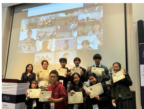
ベストディベータ賞