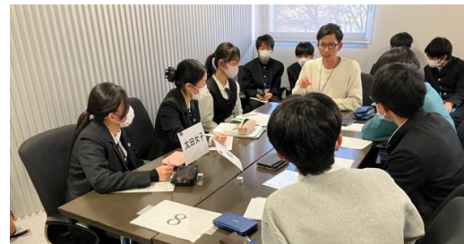
PDA 認定教育ジャッジのコメント(太田女子 VS 柏陽)

予選2の論題は「おしゃれは、害よりも利益をもたらす」でした。近年、「私らしさ」を表現する手段としてファッションを活用する人も多く見られるようになってきています。1ラウンド目でジャッジからもらったフィードバックを活かして、より良いスピーチをしようとする姿勢が多く見られました。「見た目」に関して、第一印象の大切さという意見が見られた一方で、ルッキズムに繋がってしまうという意見も見られました。また、低価格でおしゃれを楽しめるファストファッションに対して、環境問題を提起するチームもありました。様々な方向からおしゃれを分析し、白熱した議論が行われていました。