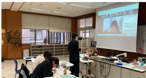
学校の様子(嵯峨野 VS 清真)