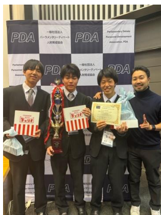
優勝 聖光学院高校