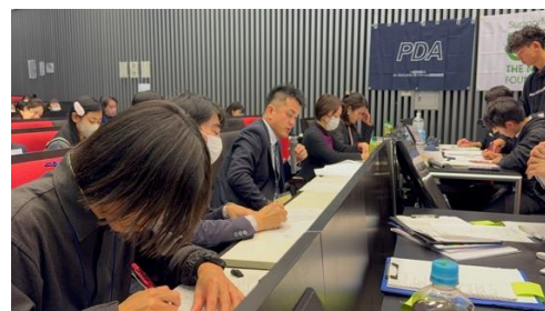
ジャッジブレイクした教員による進行