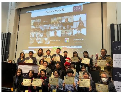
ベストジャッジ賞

・ジャッジ賞、ベストディベータ賞、POI賞、文部科学大臣賞（ベストスピーカー賞）