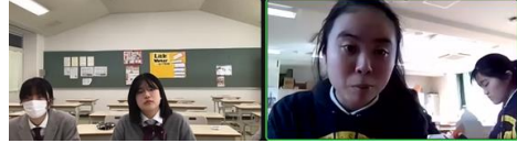
京都橘 VS 神大附属