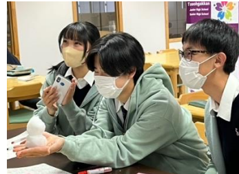
画面越しに交流 (東桜学館)