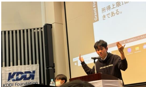
ジェスチャーを用いながらスピーチ(決勝)

レクチャーが終わり、いよいよ最後の試合が行われました。肯定側からは植民地支配など歴史的に生み出された持てる者と持たざるものの差異は非正義であって、貧困層の人々を富の再分配によって救う必要があるという話が出されました。一方で否定側は、1億円の所得制限を設けると、富裕層がタックスヘイブンに移動し、仮に能力があっても1億円を超えて働かなくなることから、国の経済にとって悪影響となることを指摘しました。積極的なPOIのやり取りが見られ、甲乙つけがたい接戦となりました。