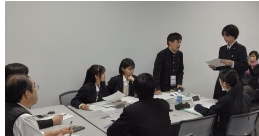
POI!(横浜翠嵐 VS 大島)