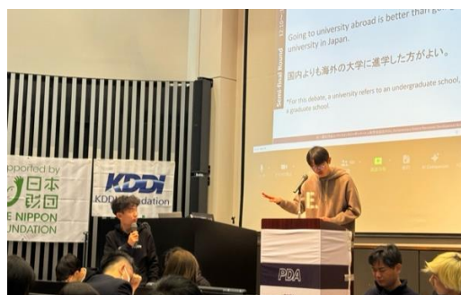
準決勝でも POI で質疑応答