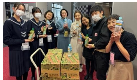
チェリオの飲料水と記念撮影