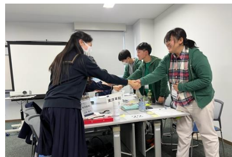
握手 (東洋英和 VS 屋代)