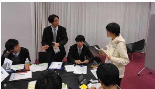
POI! (聖光 VS 長野)

予選 4 の論題は「米国はイスラエル支援をやめるべきである」でした。イスラエルとパレスチナをめぐる問題は、10月の紛争開始以降、今まさに世界中で議論の的となっています。1日目最後の試合ということで、ディベーター達は全力で議論に臨みました。ガザで多くの民間人がイスラエル軍の攻撃の巻き添えになっている事から、米国はイスラエルへの武器支援をやめるべきという主張がありました。一方で、ユダヤ人が長い間迫害されてきた歴史を踏まえるべきだという反論や、米国の中東・世界全体での影響力を維持し民主主義を守るべきだという主張も出ていました。様々な知識を組み合わせ、とても高度な議論を戦わせていました。