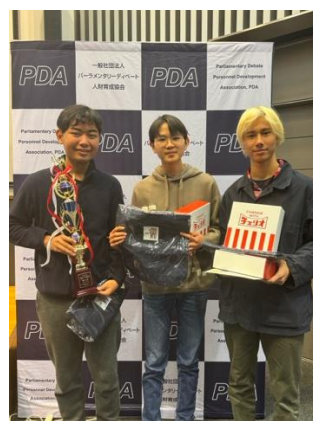
3位 筑波大学附属駒場高校