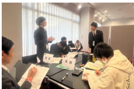
PDA 認定教育ジャッジ・POI (慶應 VS 長野)

大学無償化に対して、貧困層の教育機会の拡充という議論が出ていた一方で、大学を無償化するのではなく高校までを無償化するべきだという意見も見られました。勉強に対するモチベーションへの効果など、実際に進路を考える状況にある高校生ならではのリアルな視点からの意見もあり、議論が深められていました。