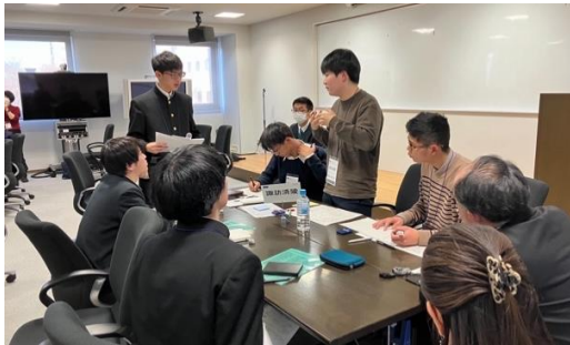
POI (慶應 VS 諏訪清陵)