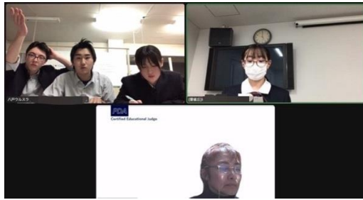
画面越しに POI! (八戸ウルスラ VS 雲雀丘)