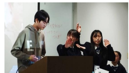
POIの応酬がつづきます

決勝戦の後、表彰式が行われました。チーム賞、個人賞の授与が行われると同時に、文部科学省・外務省後援 第9回 PDA 高校生パラメンタリーディベート世界交流大会への出場権を手に入れた学校も発表されました。