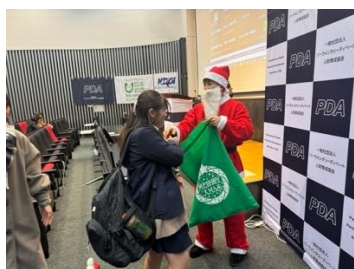
サンタクロースからプレゼント

大会 1 日目はクリスマスイブ前日。PDA 学生スタッフがサンタクロースに扮し、参加者にチョコレートのプレゼントを配りました。参加者同士交流を楽しみ、1日目が終了しました。