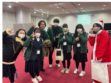
サンタクロースと記念撮影