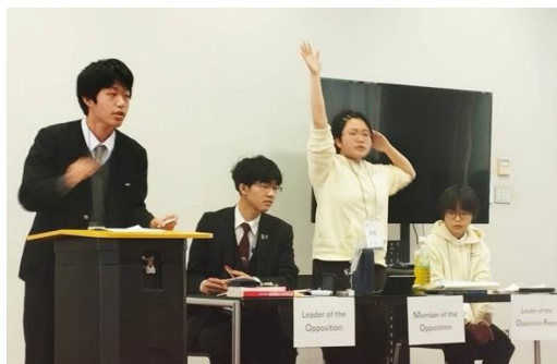
POI! (聖光 VS 長野)

準々決勝は4つの会場で行われました。そのうち3つの会場では、現地対オンラインのハイブリッド対戦となりました。予選以上にPOIが活発に出され、多くの生徒が観戦する中堂々とスピーチを行いました。しっかり調べたり、コンセンサスをとる努力をしたりすることと、とにかくスピードを重視し、何か課題が生まれてもそれをさらにスピーディに乗り越えていく方がより多くの課題を解決できるのではないかと、など時間をかけることとスピードを重視することそれぞれのメリット・デメリットについて具体例を交えながら白熱したディベートが展開されました。