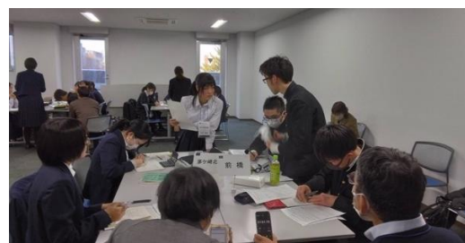
POI!(茅ヶ崎北陵 VS 前橋)