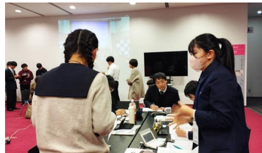
POI!(市立浦和 VS 青森)