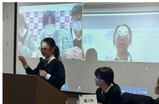
東桜学館 VS 城ノ内