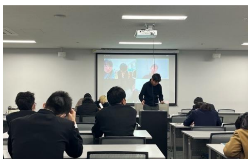
筑駒 VS 岐阜