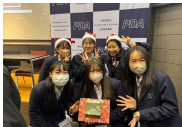
他校生徒と仲良くなりました