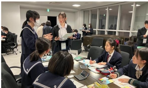
POI!(湘南白百合 VS 日比谷)

予選3の論題は「日本を変えるなら、政治よりも商売を選ぶべきである」です。実生活に直接結びつけることがやや難しい論題であったため、実際過去にどのようなことがあったかなどの具体例の提示が勝敗を左右していたように見られました。予選3ラウンド目ということもあり、さらなる積極性がみられました。二つ試合を終えた生徒たちはブラッシュアップされていました。自分たちが言いたいことに繋げることができるような質問を戦略的に行いました。