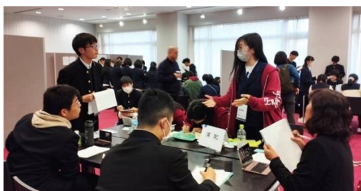
POI!(県立浦和 VS 盛岡第一)

予選2の論題は「おしゃれは、害よりも利益をもたらす」でした。近年、「私らしさ」を表現する手段としてファッションを活用する人も多く見られるようになってきています。1ラウンド目でジャッジからもらったフィードバックを活かして、より良いスピーチをしようとする姿勢が多く見られました。「見た目」に関して、第一印象の大切さという意見が見られた一方で、ルッキズムに繋がってしまうという意見も見られました。また、低価格でおしゃれを楽しめるファストファッションに対して、環境問題を提起するチームもありました。様々な方向からおしゃれを分析し、白熱した議論が行われていました。