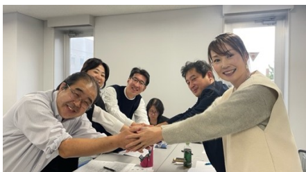
ディベート後は健闘をたたえて握手を交わします