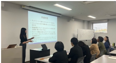
ジャッジレクチャーも実施されました