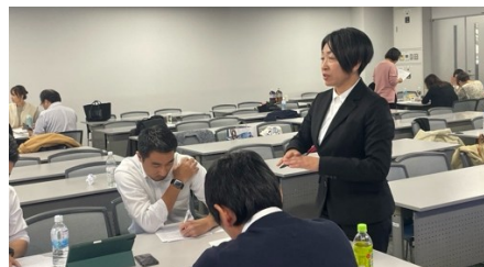
ディベート実践の様子