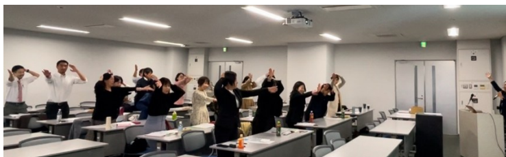
冒頭のルール確認では恒例のPOI練習を行いました

全国の教員を対象とした即興型英語ディベート研修大会を実施しました。本大会では、教員同士が議論を通じて指導力を向上させることを目指し、参加者は過去のPDA高校生即興型英語ディベート全国大会で高校生が実際に取り組んだ論題で、ディベート2回（肯定・否定）とジャッジ1回を行い、参加者同士でフィードバックを交わしました。また、この研修大会は、2024年12月24日・25日に開催予定の「第10回PDA高校生即興型英語ディベート全国大会2024」の準備を兼ねたものです。ディベート後や休憩時間は、教員同士、生徒が取り組んだディベート実践にどうフィードバックをしているかなど情報交換を行う場面も見られました。