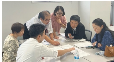
ディベート後の情報交換