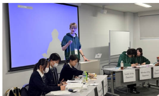
準々決勝（城ノ内 VS 柏陽）