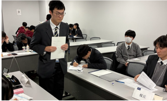
太田女子 VS 桜丘