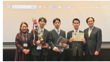
優勝 聖光学院高等学校