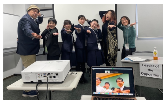
POI！（東海 VS 日比谷）

準々決勝・ランダムマッチが終了した後は、昼休憩の時間が設けられました。現地会場では、学校の垣根を越えて参加者が集まり、輪になってプレゼントを交換する企画が行われました。この取り組みを通して、生徒同士の会話が自然と生まれ、学校間の交流がより深まる様子が見られました。昼食の時間帯においても、ディベートの感想やこれまでの試合について語り合うなど、活発なコミュニケーションが続いていました。一方、オンライン参加者に向けては、レクリエーションとして Zoom のブレイクアウトルームを活用した交流企画が実施されました。対面とは異なる形ながらも、生徒同士が互いに交流を深める機会となりました。