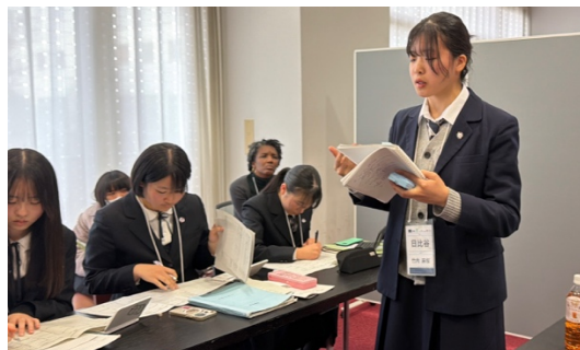
スピーチの様子（太田女子 VS 日比谷）