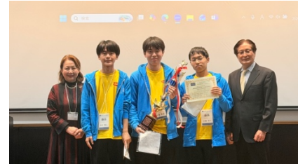
準優勝 福井県立藤島高等学校