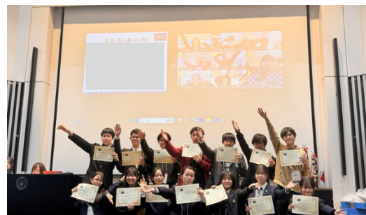
ベスト POI 賞