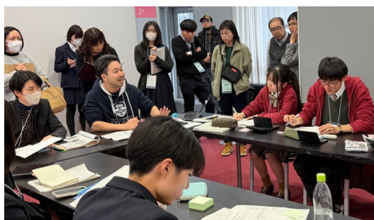
ジャッジによるフィードバック

予選第2ラウンドの論題は「日本は、定年制を廃止すべきである。」でした。少子高齢化が進む日本社会において、労働力不足や高齢者の働き方が課題となる中、高校生にとっても身近な社会問題として関心を集めるテーマでした。