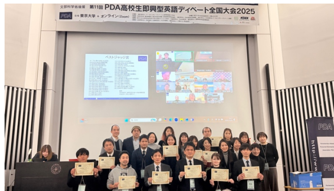
ベストジャッジ賞

・ジャッジ賞、ベストディベーター賞、POI 賞、文部科学大臣賞（ベストスピーカー賞）