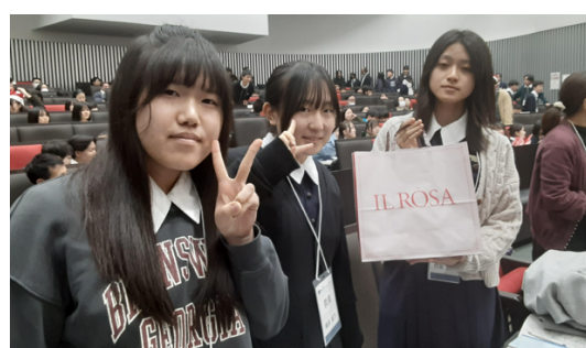
プレゼント交換も楽しみました