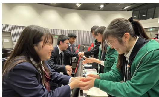
握手（雲雀丘 VS 一関第一）