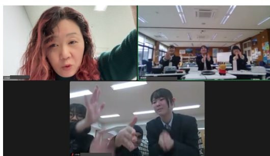
握手（嵯峨野・千早）