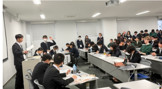
準決勝（聖光 VS 城ノ内）