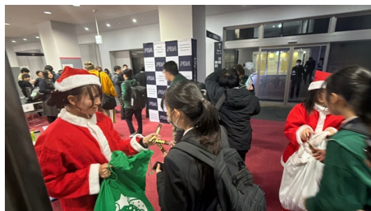
サンタクロース（PDA スタッフ）からチョコレートを受け取っています