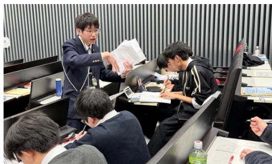
スピーチ（三田 VS 多摩）

た。定年制廃止による評価基準の不明確さや労働環境への影響についても論点となり、働く世代全体への影響を踏まえながら、予選第 1 ラウンドでの学びを活かした活発な議論が行われました。