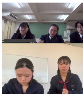
四日市 VS 鶴丸