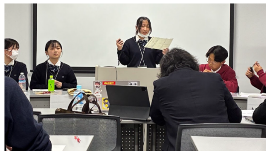
3 位決定戦（城ノ内 VS 岡山大安寺）

最後に表彰式が行われ、チーム賞および個人賞の授与が行われました。あわせて、文部科学省・外務省後援 第 11 回 PDA 高校生パラメンタリーディベート世界交流大会への出場権を獲得した学校の発表も行われ、会場には大きな拍手が送られました。