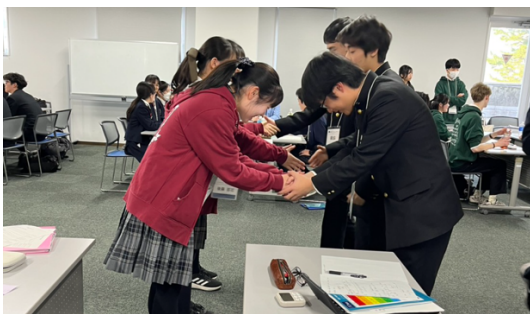
握手（水戸第一 VS 獨協）