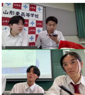
山形東 VS 具志川