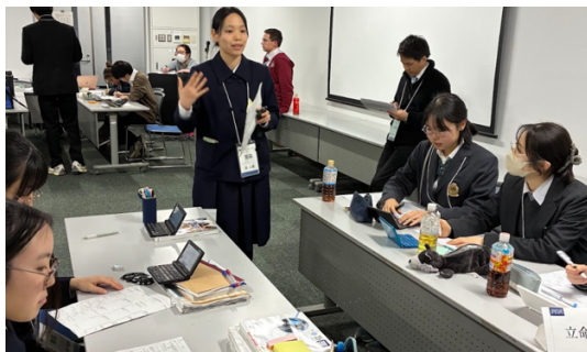
青森 VS 立命館

また、AIに判断を委ねた場合の責任の所在や、誤った判断がなされた場合に誰が責任を負うのかといった点も重要な論点となりました。予選最後のラウンドということもあり、これまでのラウンドで得た学びを活かしながら、最後の一秒まで全力で意見を述べる姿が多く見られ、非常に熱意にあふれるラウンドとなりました。