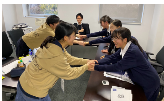
握手（屋代 VS 松蔭）