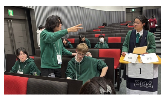
POI（柏陽 VS 清真）