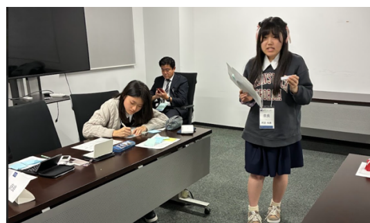
奈良 VS 筑駒