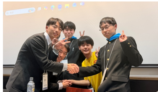
決勝（聖光 VS 藤島）