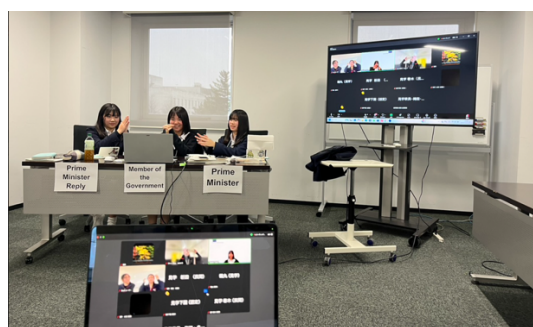
ランダムマッチ ディベート後の握手（茅ヶ崎北陵 VS 鶴丸）