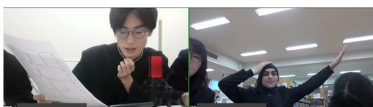
POI（盛岡第一 VS 千早）