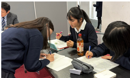
準備時間の様子（南山）

一方、否定側からは、学力成績を入試の中心に据えることの公平性や透明性の重要性、地域的多様性を優先することによって学力評価が軽視される懸念などが挙げられました。また、地域的多様性をどのように定義・測定するのかといった制度設計上の課題についても言及が見られました。大学入試において何を最も重視すべきなのか、また大学が果たすべき役割とは何かについて、多角的な視点から議論が交わされ、初戦から非常に充実したラウンドとなりました。