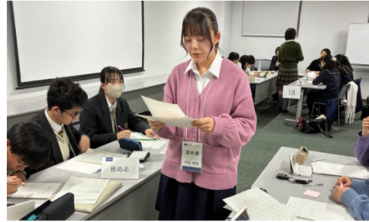
徳島北 VS 清水東

予選第4ラウンドの論題は「人間の政治家による判断よりも、AIによる判断の方が良い。」でした。近年、AI技術の発展により、行政や政策決定へのAI活用の可能性が議論される中で、政治における意思決定の在り方を根本から問う論題となりました。