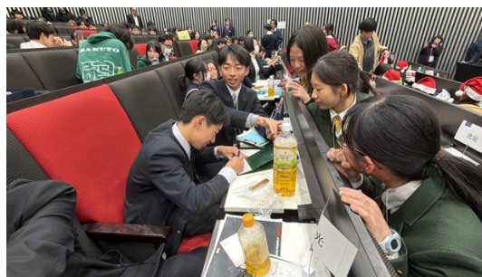
交流しながら昼食をとりました