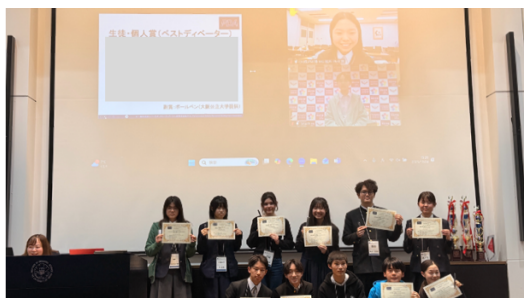
ベストディベーター賞