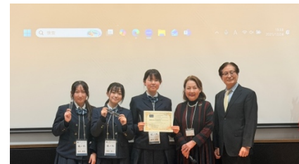
3 位 徳島県立城ノ内中等教育学校

PDA では、ディベートの強いチーム作りをした学校だけではなく、一般生徒向けに、学校全体で即興型英語ディベートの授業導入された学校を称えます。授業導入賞は、提出された書類やカリキュラムから選ばれました。