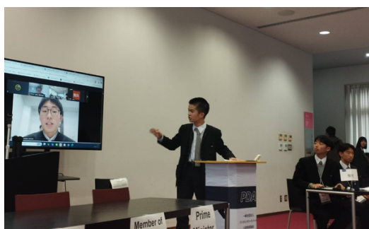
準々決勝（甲南 VS 聖光）

試合では、予選ラウンド以上に POI（Point of Information）が活発に出され、多くの生徒が観戦する中で、ディベーターたちは堂々とスピーチを行っていました。肯定側・否定側それぞれが、多数派に従うことの利点や問題点を具体例とともに示し、集団として意思決定を行う際に何を重視すべきかについて、深い議論が交わされました。重要な局面での判断基準や、少数意見をどのように扱うべきかといった点も論点となり、緊張感のある白熱したラウンドとなりました。