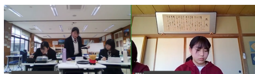
スピーチ（嵯峨野 VS 伊那北）