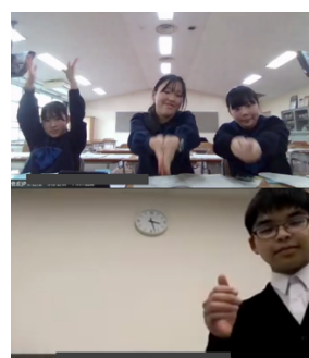
握手（香住丘 VS 東海）

予選第 2 ラウンドと予選第 3 ラウンドの間には、特別講演および実践セッションが行われました。はじめに、東京都立武蔵高等学校の中村隆道先生より、AI ディベートシステムを用いた授業の取り組みについてご紹介がありました。