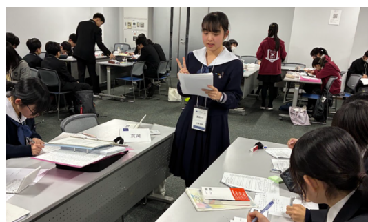
真岡女子 VS 柏