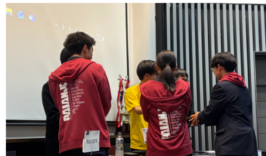
準決勝（岡山大安寺 VS 藤島）

準決勝終了後、決勝戦および三位決定戦が同時に行われました。決勝および三位決定戦の論題は「日本は、核兵器を持つべきである。」でした。日本の安全保障や国際社会における立場を問う非常に重いテーマであり、生徒たちは歴史的背景や国際関係、倫理的観点などを踏まえながら、慎重かつ真剣に議論を展開していました。