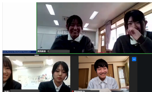
交流（関西創価 VS 岐阜）